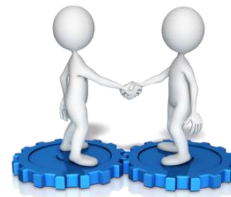
8. Joint Ventures