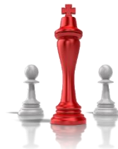
12. Business automatisieren